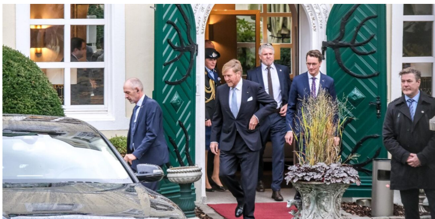
Zum Frühstück gab's Gouda „Unkomplizierter“ König Willem-Alexander gastiert in der Engelsburg